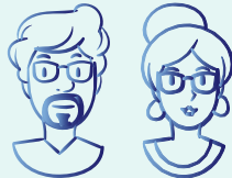
Le directeur de l'établissement