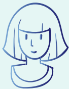
L'auxiliaire de puériculture