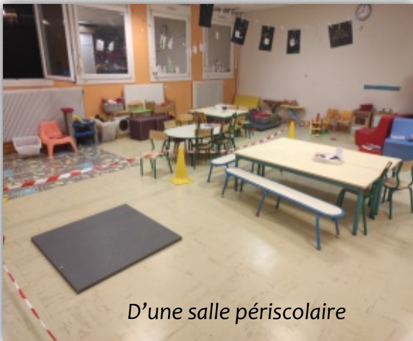
D'une salle périscolaire