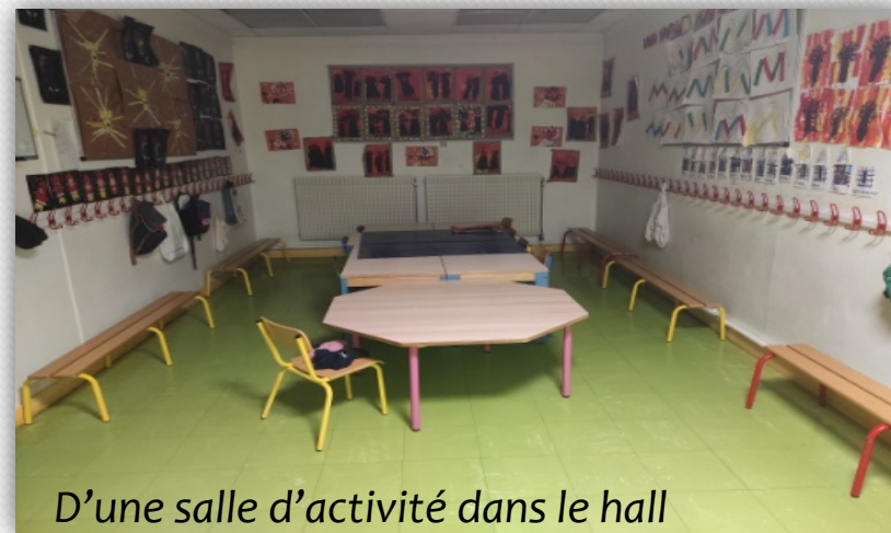
D'une salle d'activité dans le hall