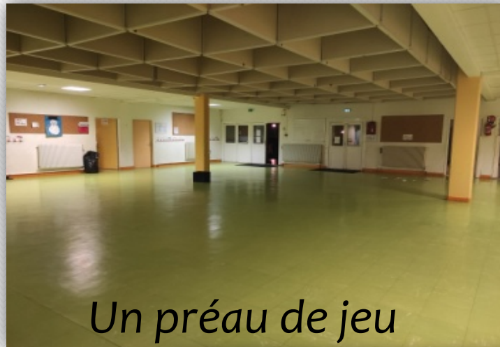
Un préau de jeu