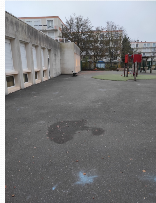
La cour des grandes sections