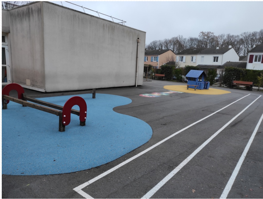
La cour des petites et moyennes sections