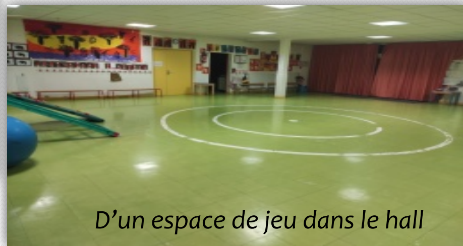
D'un espace de jeu dans le hall