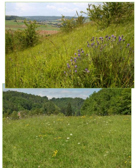
Illustration de milieux susceptibles d'accueillir le gomphocère roux (c)

Cette espèce de criquet ne séjourne pas en permanence au niveau du sol , il s'aventure souvent dans la végétation . Son chant est long et progressif ce qui le rend particulièrement reconnaissable pour les oreilles attentives (4) .