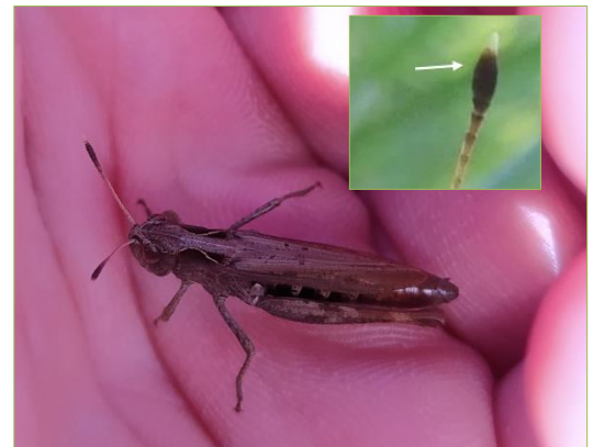
Photo d'un gomphocère roux sur une prairie située à Magny-les-Hameaux (b)

Le gomphocère roux possède notamment une paire d' antennes épaissies en massues à leur extrémité et la pointe de cette extrémité (apex) est-elle-même blanche (1) comme on peut le voir sur l'illustration ci-contre.