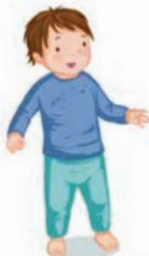
SE TENIR DEBOUT

RIEN NE SERT DE BRÛLER LES ÉTAPES : C'EST EN LAISSANT L'ENFANT LES FRANCHIR, À SON RYTHME, QU'IL PROGRESSERA.