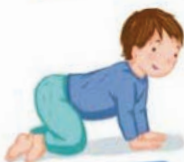
SE METTRE À 4 PATTES