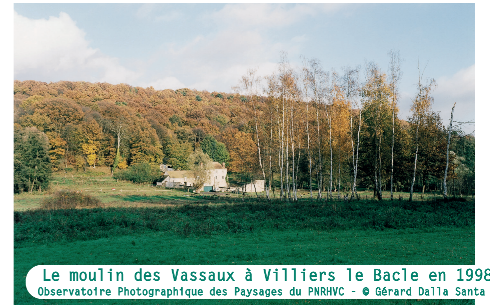
Le moulin des Vassaux à Villiers le Bacle en 1998

A l'époque, c'est une grande victoire et un outil majeur de protection, qui nous permet de bénéficier tous encore aujourd'hui d'un site exceptionnel si près de Paris.