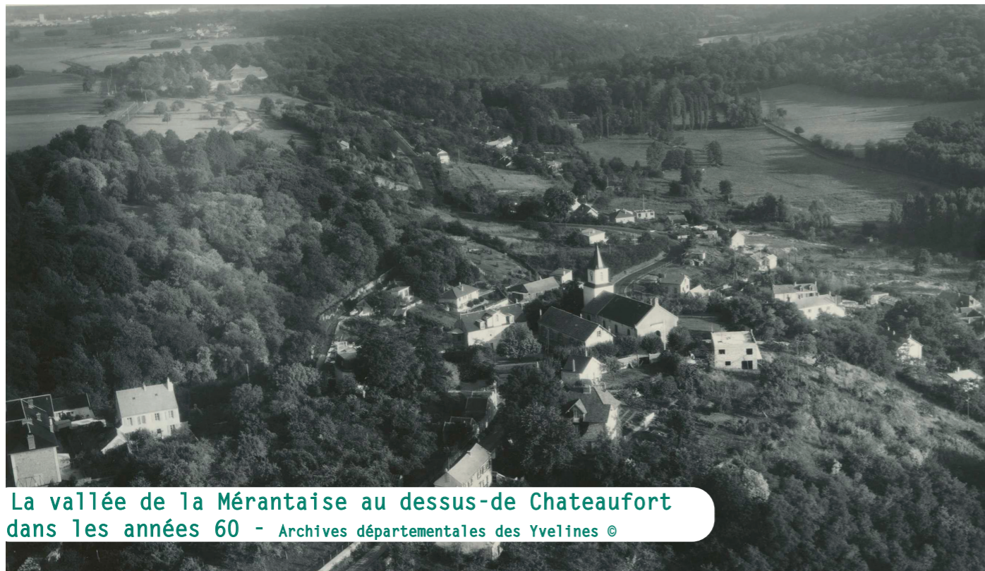
La vallée de la Mérantaise au dessus-de Chateaufort dans les années 60

Il décide alors d'interpeller les différents ministères et syndicats en charge de la préservation de l'environnement. En novembre 1966, la vallée de la Mérantaise est inscrite à l'inventaire des sites pittoresques de Seine et Oise, par un arrêté ministériel, première victoire. Pourtant, les dépôts de gravats se poursuivent.