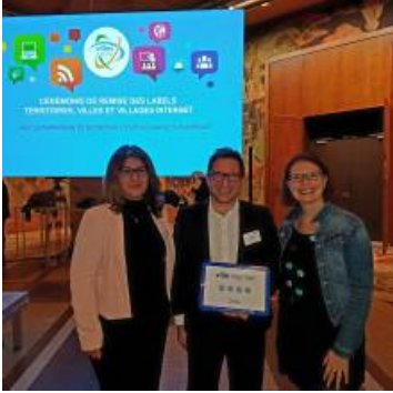
«Le-ble-Planer sur Internet?», Causation de roman sur plus d'un milliard de personnes sur la ville.