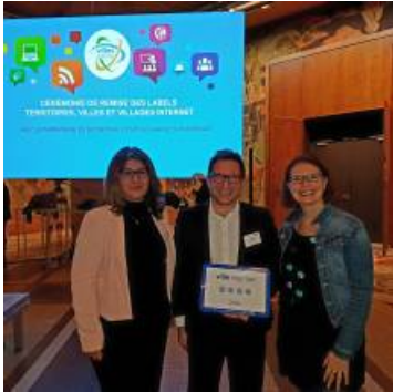
«Le-4e France sur Internet?», Causette de presse sur place d'un événement de promotion sur la ville.