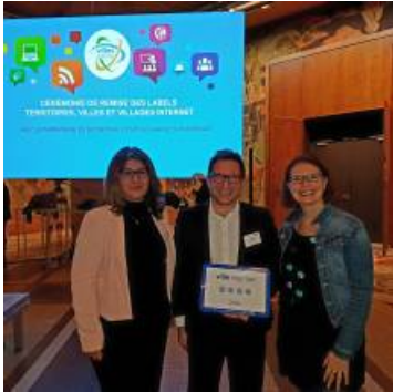
« Ville de France sur Internet? » Concours de remise aux plus d'ancienneté de présence sur la toile.