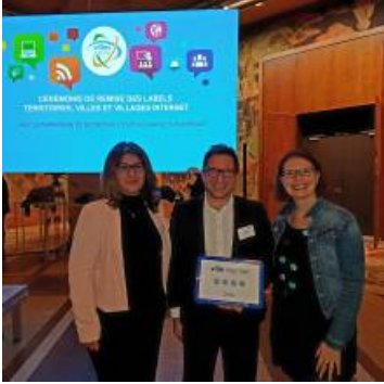
« Ville de France sur Internet? » Concours de remise aux plus d'ancienneté de présence sur la toile.