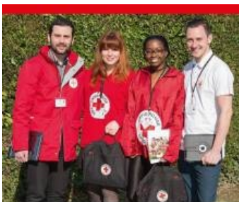
Nos équipes viennent au domicile des habitants pour leur présenter les actions menées par la Croix-Rouge française avec pour objectif de collecter de nouveaux soutiens réguliers. Comment les reconnaître ? - Ils portent un badge et une tenue aux couleurs de la Croix-Rouge

Ces campagnes visent à sensibiliser les individus sur les missions d'intérêt général de la Croix-Rouge française. Elles ont également pour objectif de trouver de nouveaux soutiens réguliers, mais ne feront pas l'objet d'une quête en espèces ou en chèques.