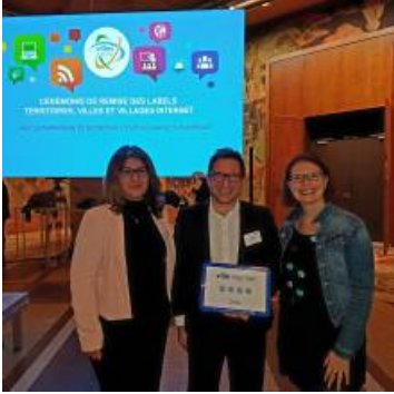
«Le-ble-Planets sur Instagram?», Concours de photos sur photo d'un territoire de territoire sur la ville.