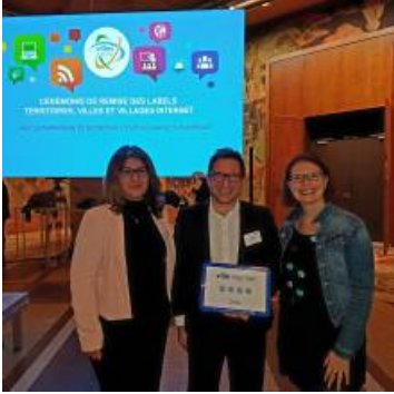
«Les villes sont-elles vraiment connectées?», Conférence de presse sur le prix d'excellence de promotion sur la ville.