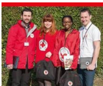
Nos équipes viennent au domicile des habitants pour leur présenter les actions menées par la Croix-Rouge française avec pour objectif de collecter de nouveaux soutiens réguliers. Comment les reconnaître ? - Ils portent un badge et une tenue aux couleurs de la Croix-Rouge

Ces campagnes visent à sensibiliser les individus sur les missions d'intérêt général de la Croix-Rouge française. Elles ont également pour objectif de trouver de nouveaux soutiens réguliers, mais ne feront pas l'objet d'une quête en espèces ou en chèques.